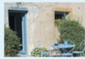
chambres d'hôtes ayant un revenu inférieur

Avis à ceux qui souhaitent s'installer : Le texte de loi de financement de la Sécurité sociale voté le 21 décembre 2010 stipule que les chambres d'hôtes sont redevables de cotisations