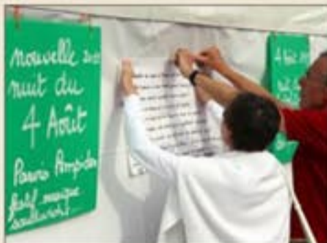
Une première initiative, hier, sur le bien nommé parvis des Droits-de-l'Homme. À suivre...

Le 4 août 1789, les nobles, le clergé et le Tiers-État ont rivalisé d'audace pour abolir les privilèges.