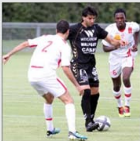
La vallée de l'Orne est supportrice du CSO Amnéville.

La vallée de l'Orne est supportrice du CSO Amnéville, son porte-drapeau, qui a réalisé une superbe saison avec l'aide de son douzième homme, le public! Pour confirmer, l'effectif n'a pas été chamboulé et nul doute que, sur sa lancée, le club peut rivaliser avec le gratin amateur et titiller le podium face aux meilleures formations du Grand-Est. Le point, club par club, dans la vallée de l'Orne.